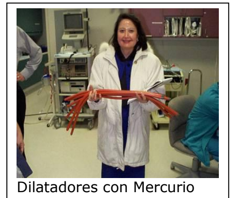
Dilatadores con Mercurio

Mediante la realización del inventario, se configurará una base de datos con las cantidades de mercurio, los instrumentos que lo contienen y las áreas en que se encuentran, etiquetando todos los dispositivos de la institución que contengan este metal tóxico (termómetros, esfigmomanómetros, amalgamas, tubos de luz, lámparas de bajo consumo, antisépticos, vacunas, interruptores, termostatos, etc.).