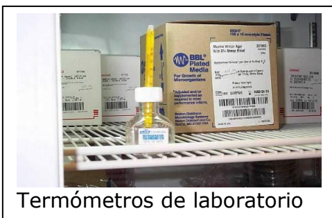
Termómetros de laboratorio

Se realizará un relevamiento pormenorizado de las cantidades de insumos o instrumentos con mercurio en uso, en stock, en reparación, almacenado como equipo obsoleto, etc., discriminado por áreas o sectores del hospital. También se deberán cuantificar, si los hubiera, los residuos con mercurio que se encuentren almacenados dentro del hospital.